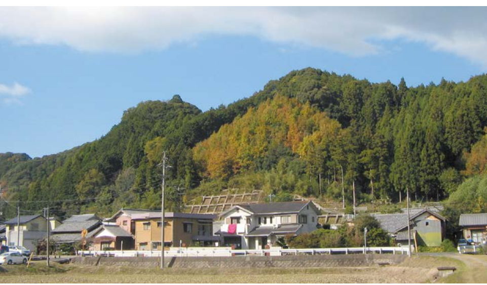
南から見た波瀬城跡の遠景

県道43号を、JR井関駅から波瀬川沿いに美杉地域を目指して進むと、右手に東西に横たわる丘陵が見えてきます。この丘陵の、標高150〜160mの尾根上に、波瀬城跡があります。丘陵の麓から徒歩で10分程、急な斜面のつづら折れの道を登ると城跡へ行くこ