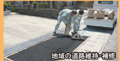
地域の道路維持・補修

地域インフラ維持・補修事業を創設し、1億5,600万円の予算執行や各総合支所職員の2人から4人の増員など、総合支所の権限・財源・人員を強化