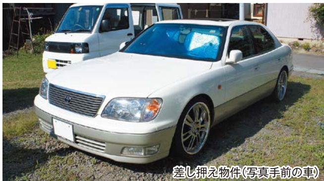
差し押え物件(写真手前の車)

その他にも、差し押えの対象としている財産は、預貯金や給与、生命保険などがあります。平成26年度には1,784件の差し押えを行い、約1億7,002万円が滞納市税に充てられました。