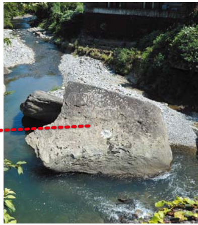
立岩橋から見た立岩

長野川に架かる美里町南長野の立岩橋から下流の方をのぞきこむと、地元で「立岩」と呼ばれる二つの大きな岩が川の真ん中に横たわっています。そのうちの手前にある幅8m、高さ6mほどの岩には、中心近くに種子といわれる、仏や菩薩を像の代わりに表した梵字(サンスクリット