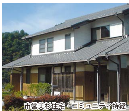
市営美杉住宅・コミュニティ持経

申し込み 10月16日(金)から配布する所定の申込用紙に必要な書類を添えて、直接市営住宅課または同課久居分室窓口へ 受付期間 11月2日(月)～6日(金)8時30分～17時15分 ※11月3日(火・祝)は除く。郵便・ファクスでの申込用紙の配布、受け付けはできません。