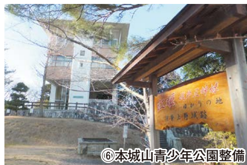
⑥本城山青少年公園整備