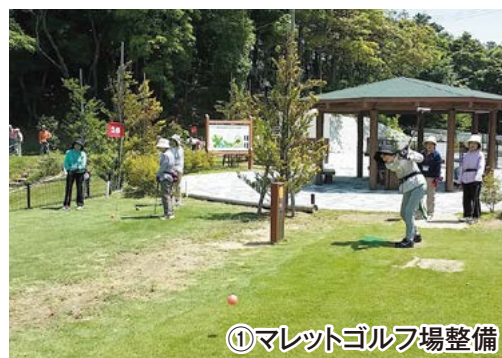
①マレットゴルフ場整備