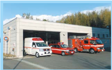
⑱北消防署河芸分署移転整備