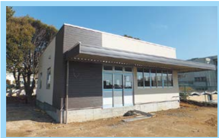
⑮千里ヶ丘放課後児童クラブ新築