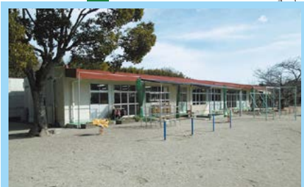
⑬黒田幼稚園耐震補強