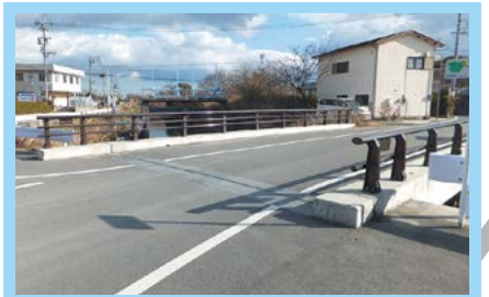
④上野東千里線(瓶冠橋)道路改良