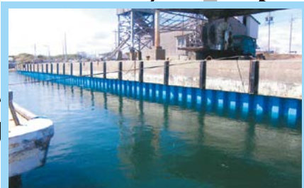
⑤河芸漁港機能保全対策