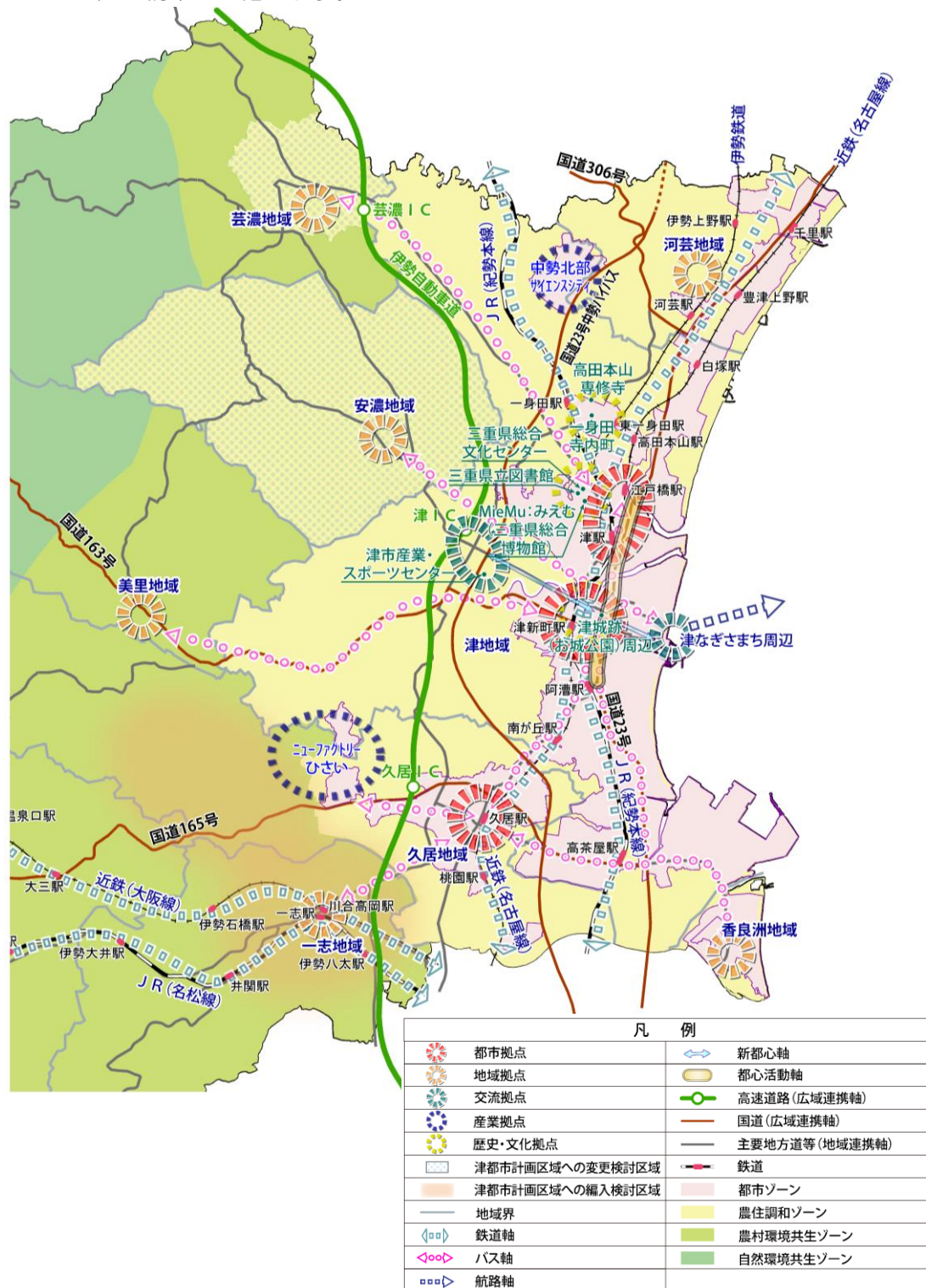
■将来都市構造図(津市都市マスタープラン)

都市づくりの基本目標を実現するため、「津市都市マスタープラン」における将来都市構造の拠点配置及び交通ネットワークの位置付けを基に、次章以降で検討する居住を誘導する区域(居住誘導区域)と都市機能を誘導する区域(都市機能誘導区域)、確保すべき公共交通網(公共交通ネットワーク)の構築を目指します。