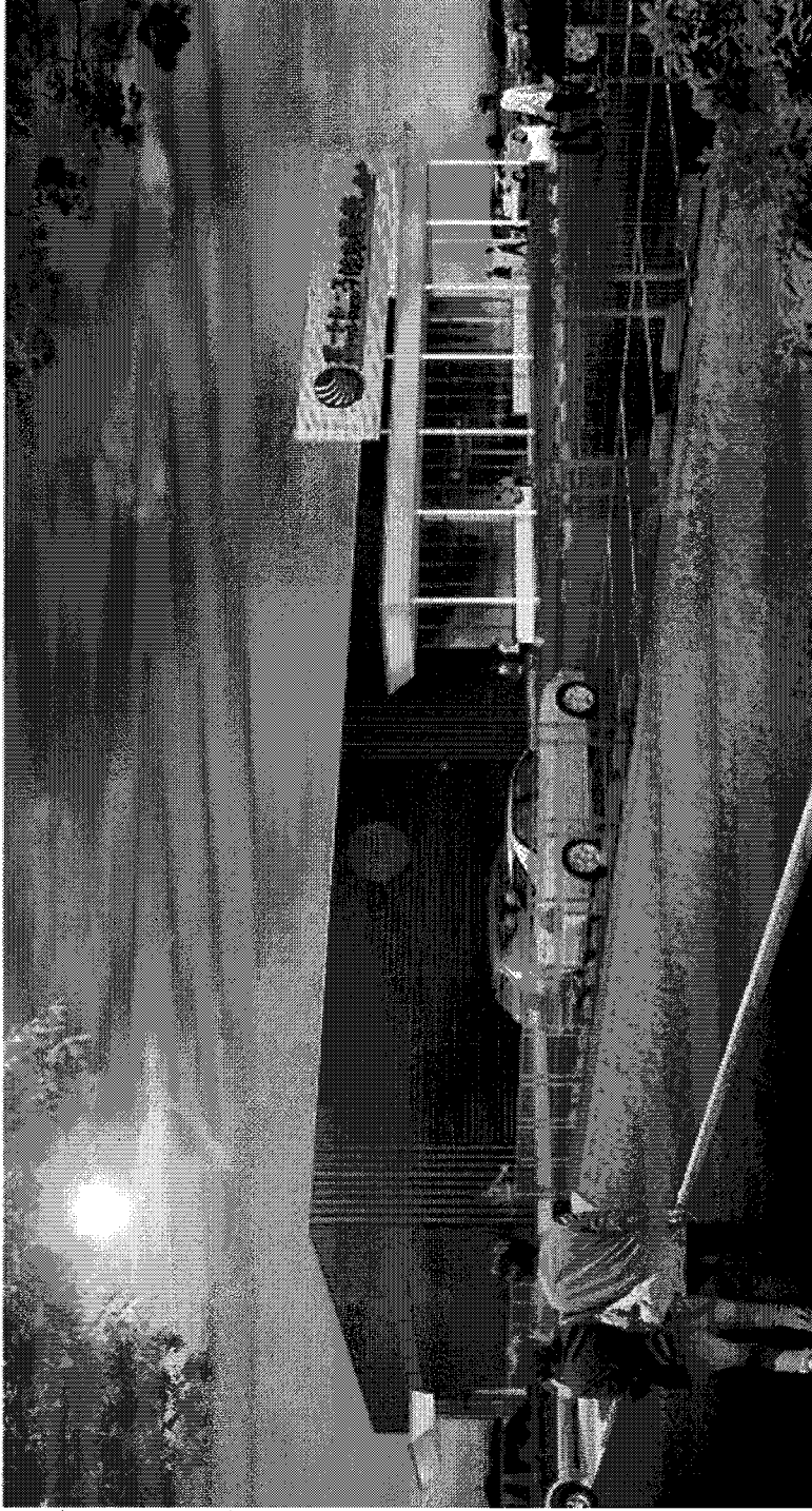
(仮称) ミニポートピア養老 外観イメージ図