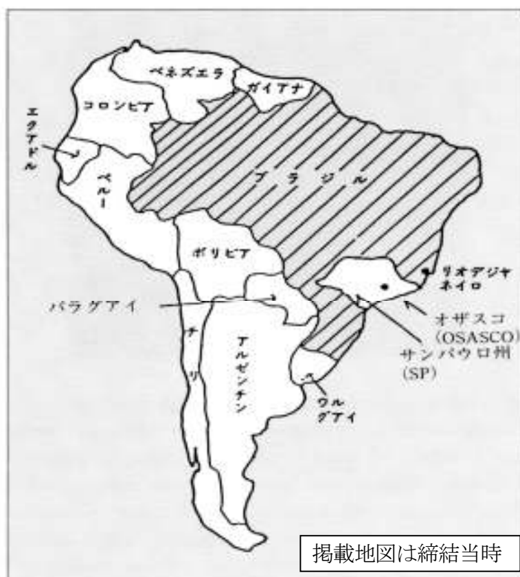
姉妹都市（ブラジル連邦共和国・オザスコ市）

オザスコ市と津市との間では、代表団の相互訪問や青少年の派遣・受入などの交流を中心に、写真や児童作品の交換、スポーツ交流や提携日を記念する交流イベントなどが行われており、平成 18 年には姉妹都市提携 30 周年を記念して、植樹式やシンポジウムを、平成 23 年には姉妹都市提携 35 周年を記念して、国際交流フットサル大会等を開催しました。