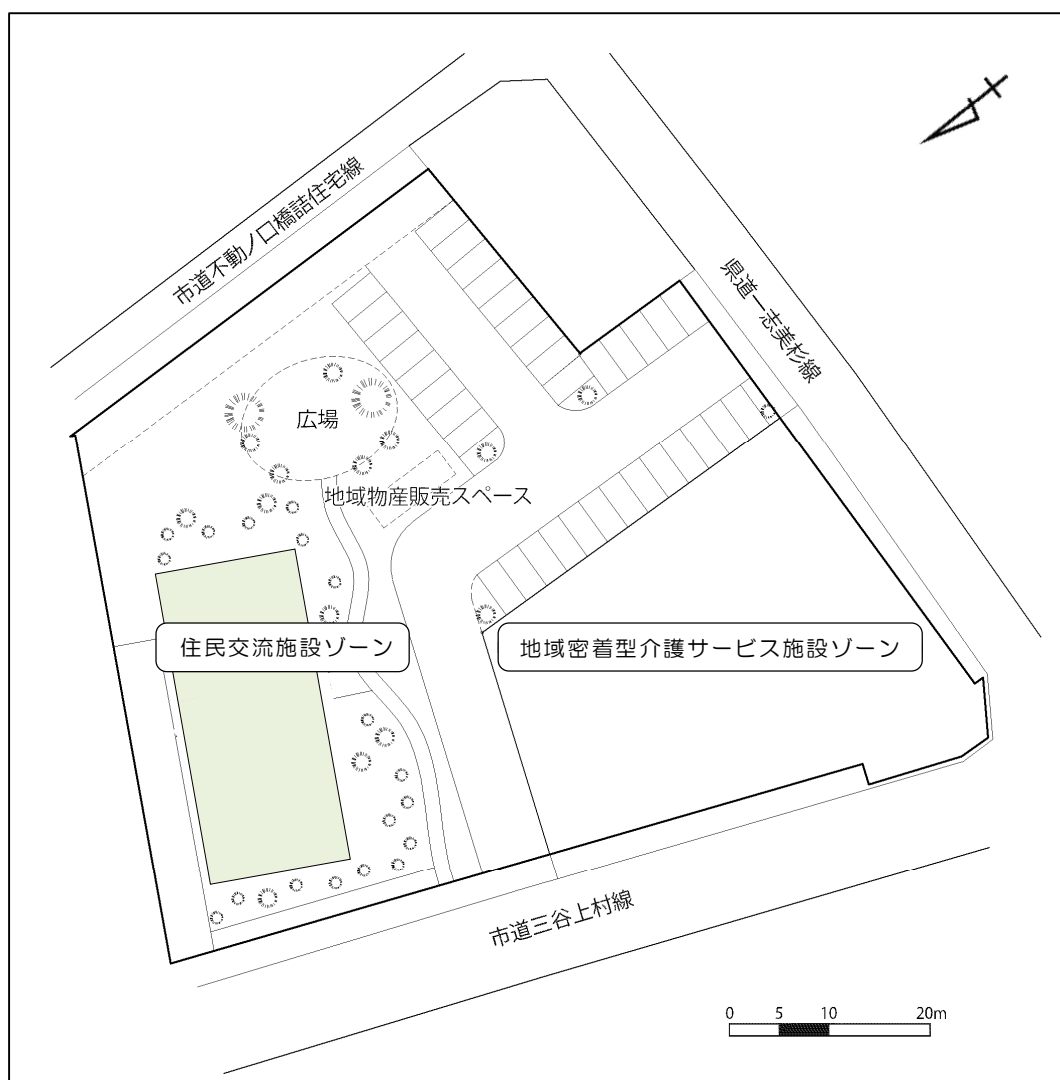
図2 施設整備構想図（配置図）