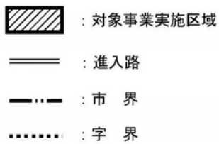
图 6-1 関係地域位置图