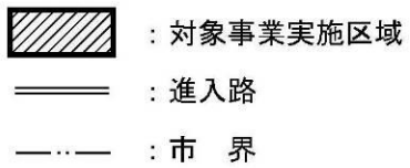
图 1.7-1 対象事業実施区域位置