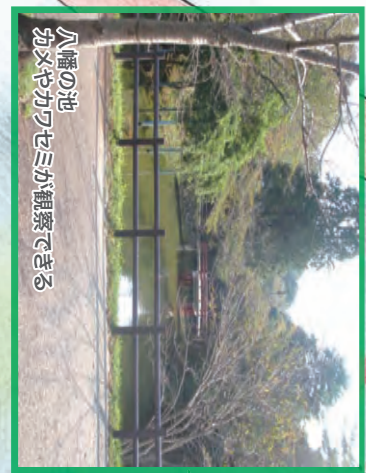
八幡の池 おみやげやカワセミが観察できる