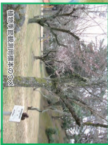
植物季節観劇用標本のウツギ