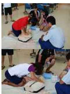
熱心に救急法の指導を受ける受講者

受講者からは「事故は起きて欲しくないですが、万一の時は受講した知識を活かしたい」と述べていました。