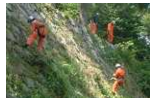
7月27日、28日津・お城の会主催のお城クリーン作戦に消防隊も参加しました