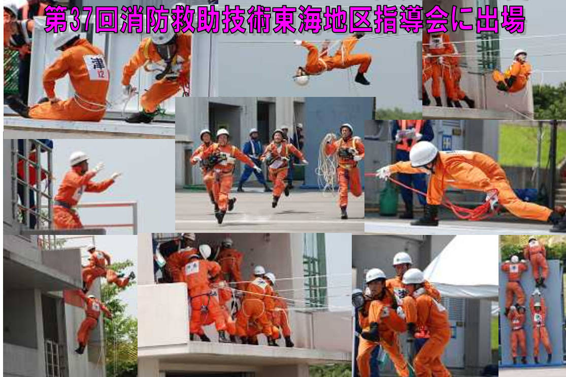
多彩な救助技術を披露する津市消防本部の救助隊員