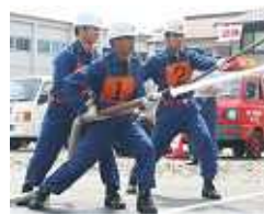
8月10日、津市一志消防団が夏期訓練の一環として操法大会を開催しました