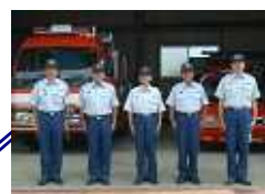
中消防署 香良洲分遣所 津市香良洲町 1862-1 TEL 292-2157