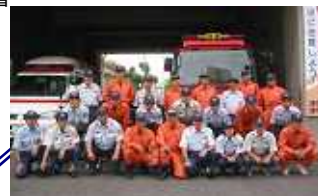
中消防署 中署 津市寿町 14番 20号 TEL 226-2580