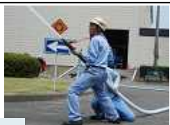
南分署の放水塔車も参加しました