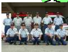
中消防署 南分署 津市雲出本郷町 1631番地 10 TEL 234-3512