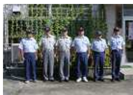
中消防署 美里分遣所 津市美里町三郷 372番地 1 TEL 279-2136