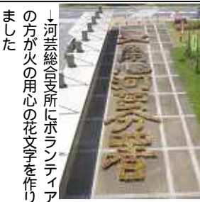
河芸総合支所にボランティアの方が火の用心の花文字を作りました