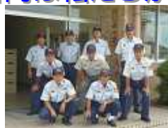
中消防署 西分署 津市一色町 257 TEL 225-7431