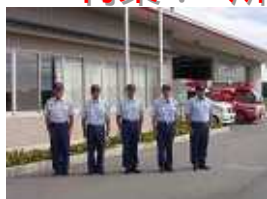
中消防署 安濃分遣所 津市安濃町川西 2097 TEL 268-5119