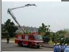
↓消火器による初期消火訓練を行う施設の職員