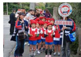
→防火パレードを行う園児

パレードは、幼稚園から二キロ離れた、とことめの里までの間で行われ、大きな声で拍子木に合わせて「火の用心」と呼びかけました。