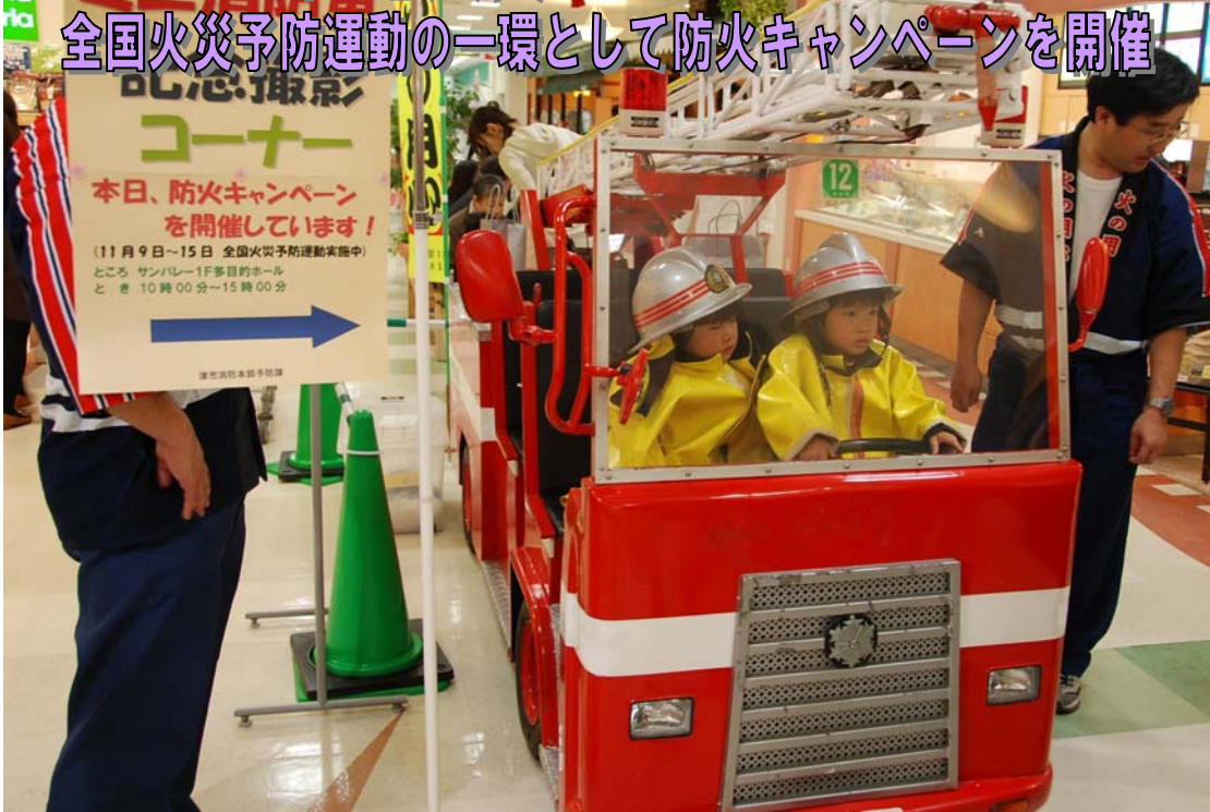
津市内のショッピングセンターにてミニ消防車で記念撮影をする子供たち