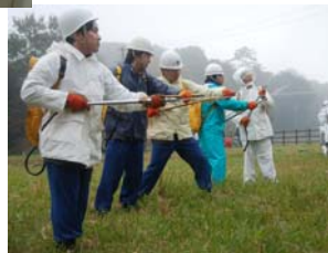
↑11月16日、津市・松阪両消防本部と、津市一志消防団の合同林野火災訓練が行われました。(消火活動を行う両市の消防隊)