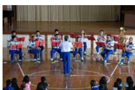
→演奏を行う津市消防音楽隊

参加した児童からは、消防という仕事をしながら、音楽隊の演奏をするのはすごいです。素敵な演奏で楽しかったです」と述べていました。