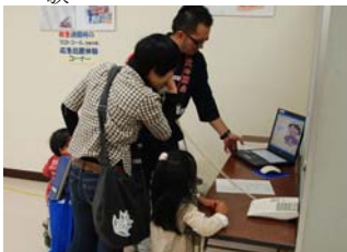
← 一一九番の通報体験を行う来場者