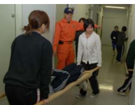
↑11月11日、三重中央看護学校の学生80名が、久居署にて、万一の災害に備え、避難誘導の方法など各種訓練を行いました。