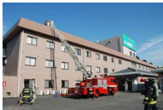
→はしご車による救出訓練を行う消防隊

訓練に参加した施設職員は、「今回は訓練ということで、お年寄りの誘導もスムーズでしたが、勤務職員の少ない日などもあるため、火を出さないよう日頃から火災予防に心がけていきたい」と述べていました。