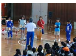
→児童と一緒に演奏を行いました