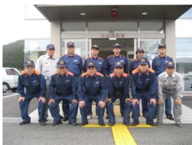
↑ 白山消防署 白山署 津市白山町南家城 2761 TEL 262-1044 FAX 262-2999