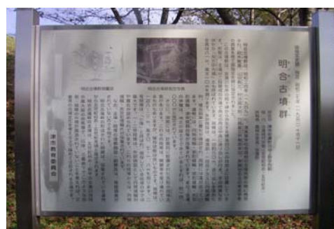
↑明合古墳群の史跡付近 (津市安濃町田端上野)

形態は、主墳が二段築成の方墳で南北の両辺に造り出しが付き、その特異な形状から「双方中方墳（そうほうちゆうほうふん）」とも呼ばれており、規模は、一辺約六十メートル、造り出しを含めた全長は八十一メートル、高さ約十メートルほどです。外部施設として、墳頂部及び一段目テラスに円筒埴輪列、墳丘斜面には葺石が確認され、周囲には濠が巡っています。遺物は、円筒埴輪・盾形埴輪・蓋形埴輪・家形埴輪・須恵器台等が採集さ