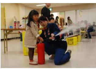
→ 模擬消火器で消火体験する来場者

このキャンペーンは、全国火災予防運動の一環として毎年津市消防本部が開催しているもので、一一九番の通報体験や消火器の取り扱い体験、防災物品や住宅用火災警報器の展示、子供から人気のミニ消防車の展示や輪投げ大会などが行われ、家族連れの親子で賑っていました。