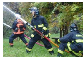
↓11月16日、津市・松阪両消防本部と、津市一志消防団の合同林野火災訓練が行われました。(ジェットシューターで消火活動を行う消防団)