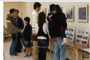
→ 防災パネルを閲覧する来場者