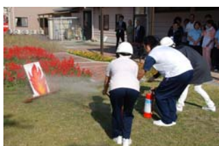
→初期消火訓練を行う施設職員