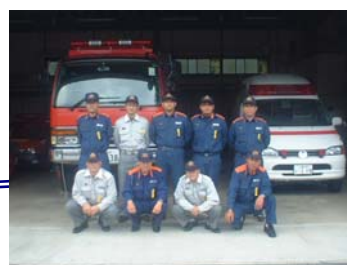
↑ 白山消防署 美杉分署 津市美杉町奥津 910-1 TEL 274-0200 FAX 274-0236