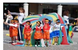
→とことめの里で遊戯をする園児