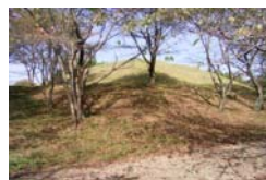
↑明合古墳群の一部

れています。また古墳の墳丘の体積は、盛土とすれば約一万四千立方メートルと推定されています。さらに周囲には、計画的に配置された方形の陪塚五基があります。この古墳群が形成された時期は、採集されている遺物から五世紀前半から六世紀始めと考えられています。現在、古墳周囲にはグラウンド・体育館・公園などが建設され、市民の憩いの場となっています。