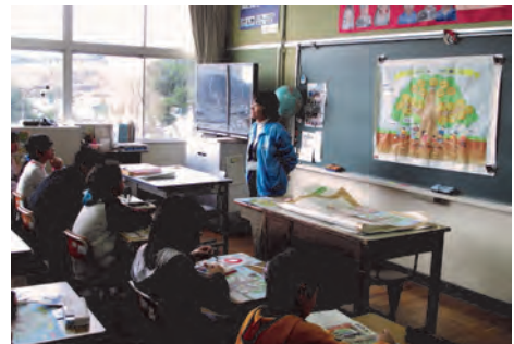
保健師による講話