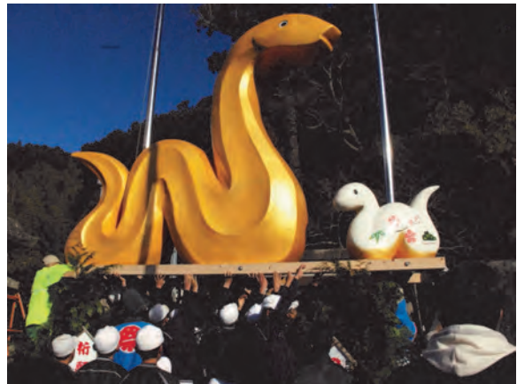
野球チームの少年たちにより持ち上げられ、設置されました。