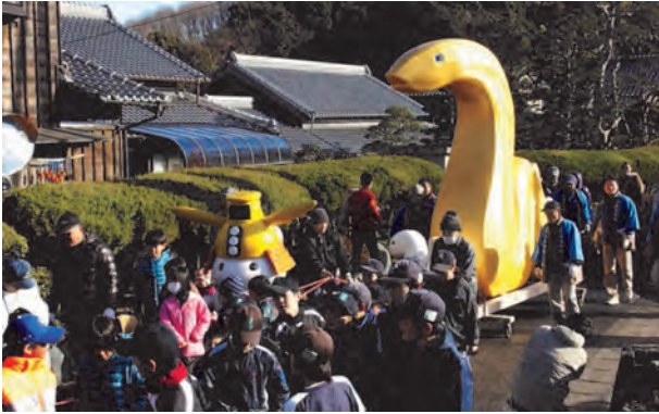
地元の子どもたちと練り歩きました。

12月29日にお披露目が行われ、地元の子どもたちに曳かれて周辺を練り歩いた後、美里町家所の辰水神社の前に展示されました。