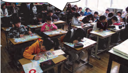
イメージ図の色塗りに取り組む子どもたち

1月10日、高宮小学校第2回学校保健委員会が開催され、5・6年生21名と保護者10名の参加がありました。