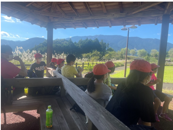
フットパークに到着！