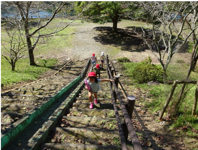
この階段、どこまでつづくの？