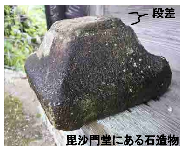
毘沙門堂にある石造物