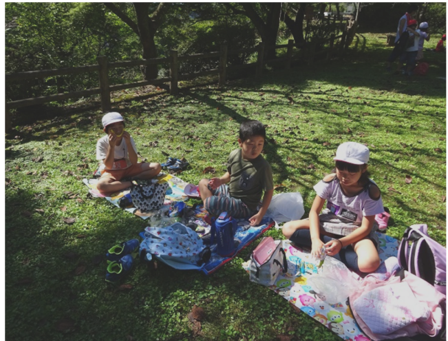
お友だちのお弁当って気になるよね。