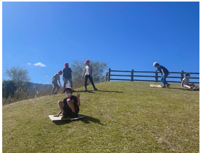
芝すべりで ヒャッホー！！