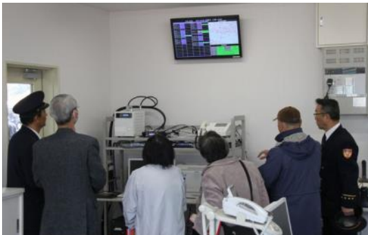
開署式の後、内覧会で地域の方々も施設を見学しました。