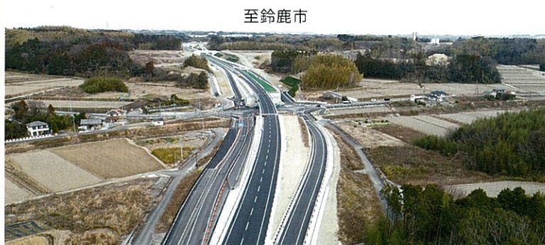
至鈴鹿市 県道三行上野線との立体交差付近

2月17日(日)、国道23号中勢バイパス(鈴鹿・津工区)の津市河芸町三行から鈴鹿市御菌町間の延長2.9kmが開通しました。国道23号中勢バイパスは、鈴鹿市北玉垣町から松阪市小津町に至る延長33.8kmの幹線道路ですが、これまで全長の約83%にあたる、約28.1kmが開通していました。今回、待望の鈴鹿・津工区が開通したことにより、津市が鈴鹿市、そして松阪市とつながることになり、企業立地の促進、救急医療の支援、現道の交通環境改善(時間短縮・交通事故減少)及び災害時の支援ルートの確保に効果が期待されています。