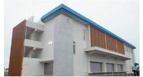
津市防災物流施設

また、3階は津市雲出地区防災コミュニティセンターとして、防災学習や地域活動などに利用できます。