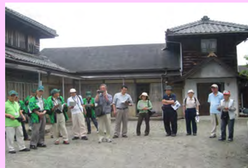
大村キリシタン抑留所跡

6月20日(水)には、公民館行事の「わが町発見講座」大三地区が行われ、大村キリシタン抑留所跡、浜城観音堂の円空仏などを訪ね、ガイドを務めました。