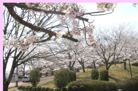
古市地内(体育館周辺) 二十数年前に植樹された約120本 の桜がきれいに咲いています。