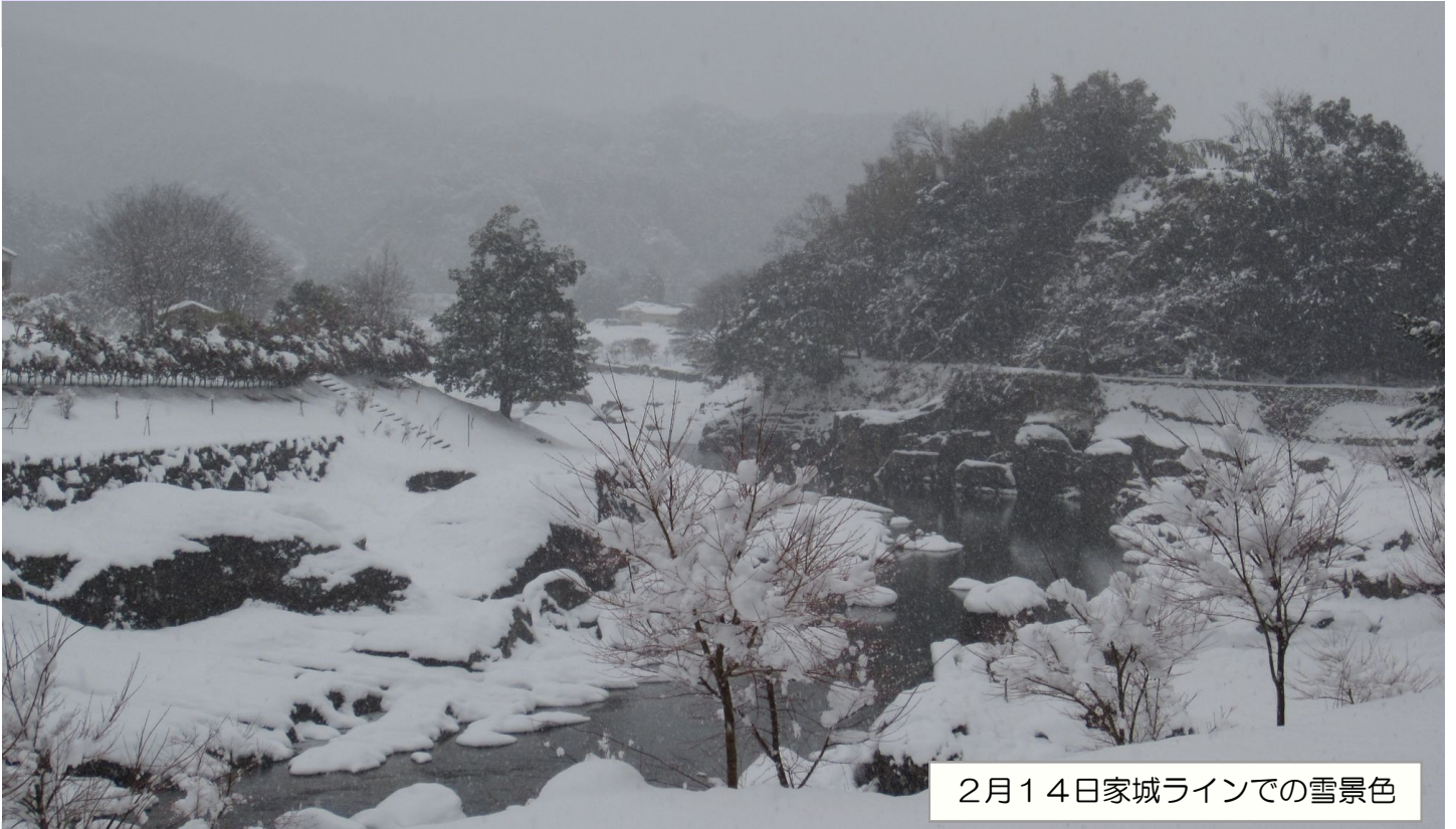
2月14日家城ラインでの雪景色