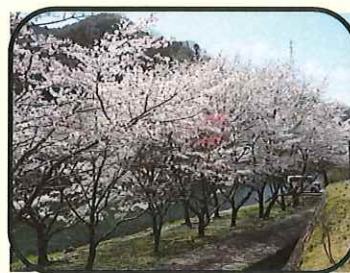
リバーパーク真見