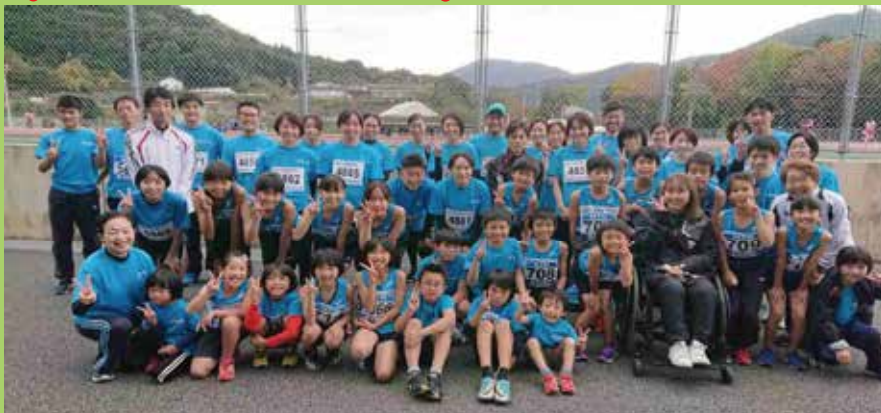
第2回津記録会/津市民体育大会 ～三重交通Gスポーツの社伊勢（三重県営総合競技場）にて～