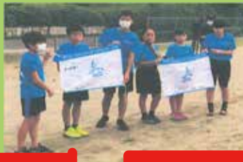
東海小学生陸上競技大会壮行会 応援幕