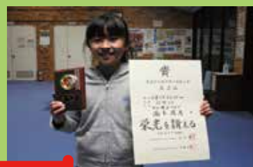
各大会で入賞された皆さん！