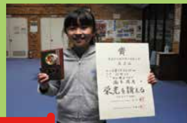
各大会で入賞された皆さん！