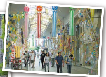
大門大通り商店街