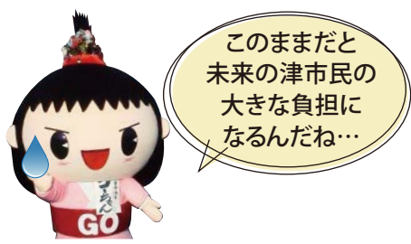
津市の人口構成予測

少子高齢化に伴い、税収の減少と、社会保障費用の増加が予想されることから、施設の整備・改修に充てられる財源は減少すると考えられます。