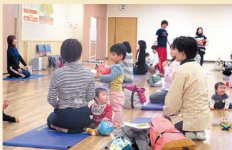
▶ 久居保健センター