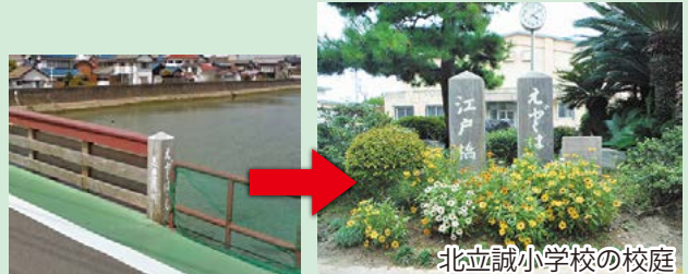
北立誠小学校の校庭