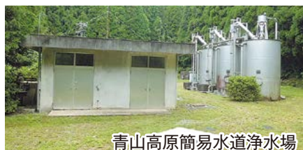
青山高原簡易水道浄水場

白山地域の青山高原、元取、福田山の3簡易水道を上水道と統合するための施設整備を実施するとともに、安心安全で良質な給水を行うため、簡易水道施設の維持管理と水質管理を行いました。