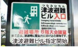
津波避難ビル指定開始