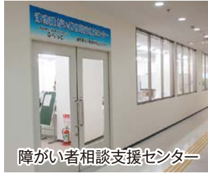
障がい者相談支援センター