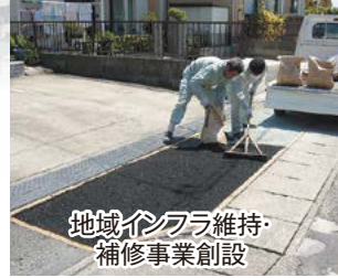
地域インフラ維持・補修事業創設