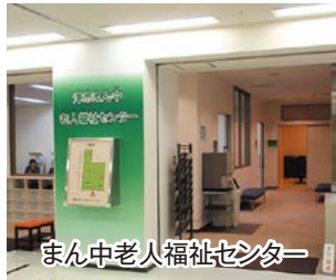
まん中老人福祉センター