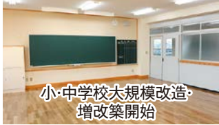
小・中学校大規模改造・増改築開始