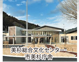
美杉総合文化センター 市美杉庁舎