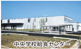
中央学校給食センター