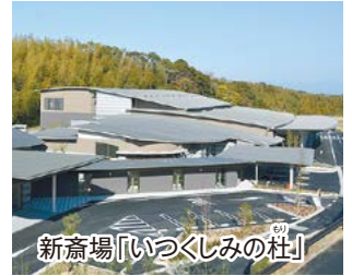
新斎場「いつくしみの杜」