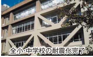
全小・中学校の耐震化完了