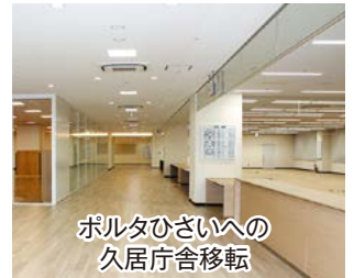
ポルタひさいへの 久居庁舎移転