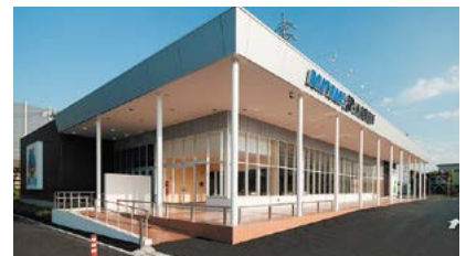
外向発売所 津インクル