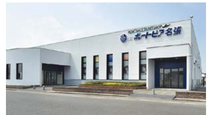
県内初の場外発売場 ミニボートピア名張