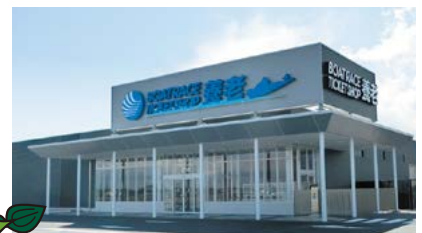
ボートレースチケットショップ養老