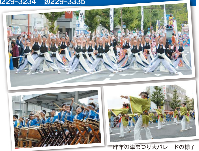
昨年の津まつり大パレードの様子