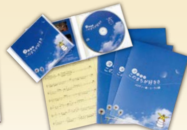
▶ 市民歌「このまちが好きさ」