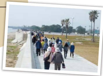
栗真町屋工区海岸堤防完成記念ウォーク

地震による津波が心配な地域の皆さんにとって、堤防が整備されることはとても安心だと思います。私も健康のために、海を見ながら堤防を歩いたり自転車で走ったりしたいですね！