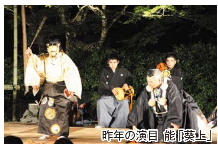
昨年の演目 能「葵上」