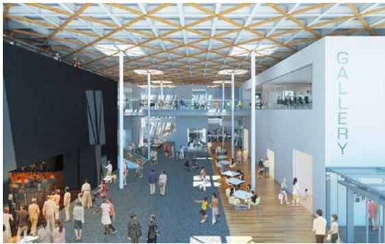
エントランスロビー