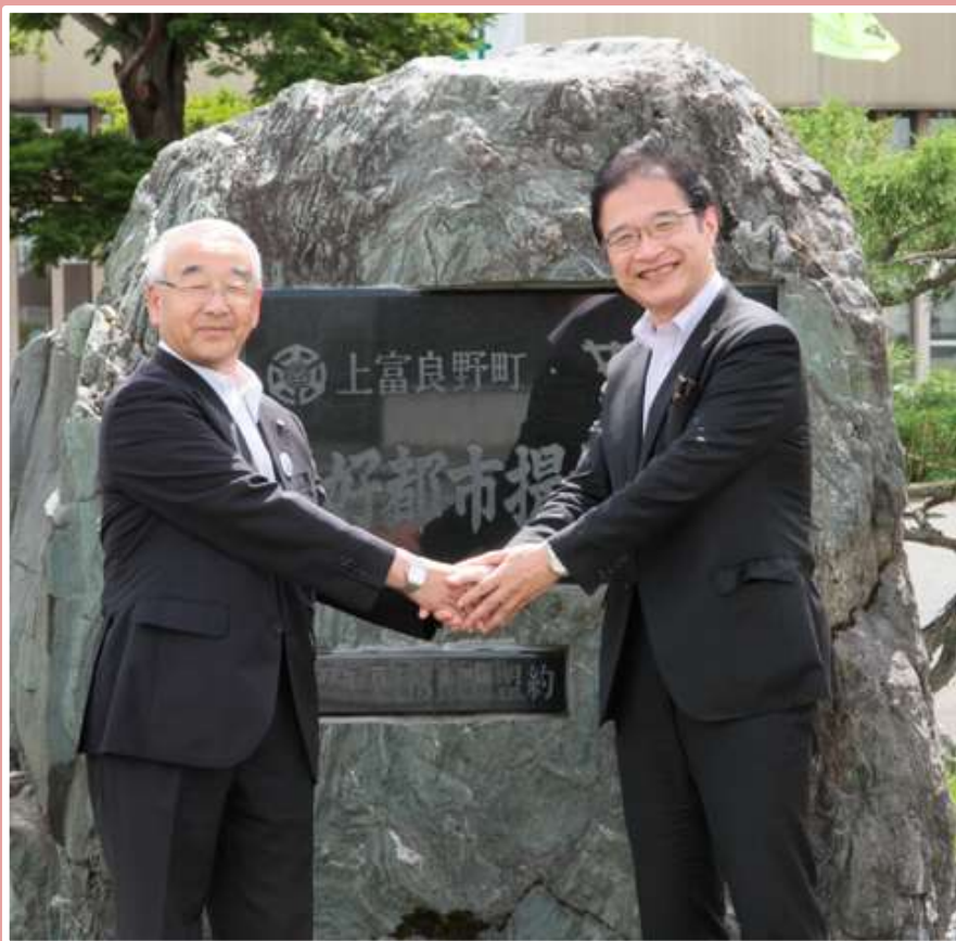
向山上富良野町長と津市長 (友好都市提携記念石碑前)