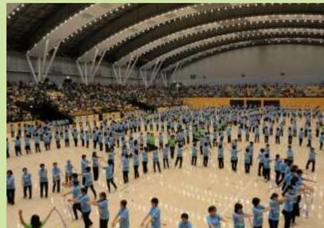
健康体操（メインアリーナ）