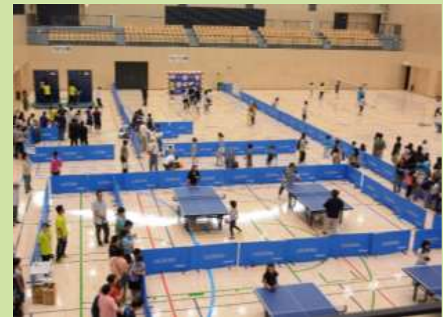
スポーツ体験会（サブアリーナ）