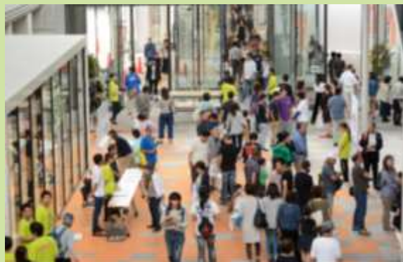
アスリートモール