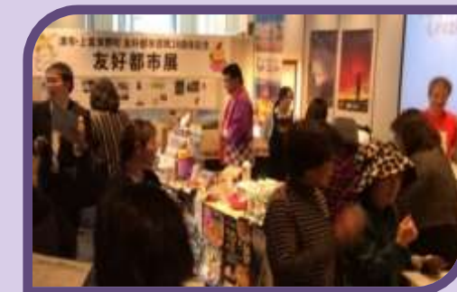
ついででの友好都市展(10月)