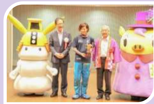
ボートレース津「GⅢ津オールレディース 上富良野町友好都市20周年」(9月)