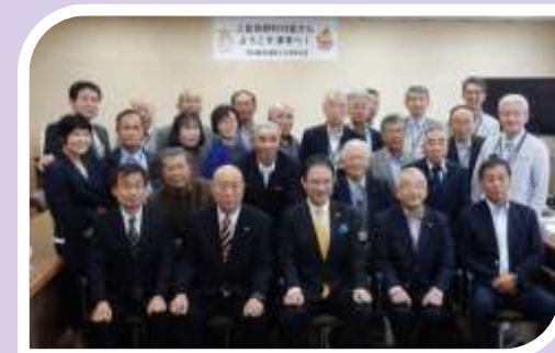
上富良野町長と町民訪問団が 津市を来訪(10月)