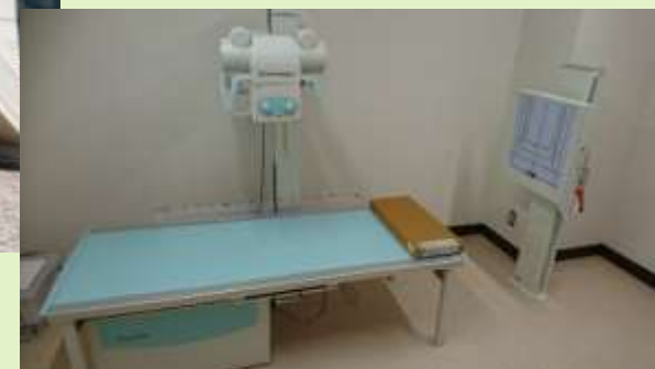
津市家庭医療クリニック(美杉町奥津地内)