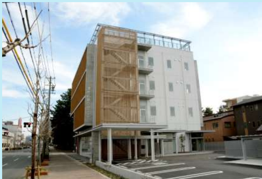
津市応急クリニック(西丸之内地内)