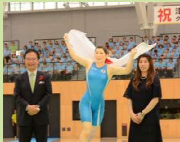
吉田沙保里選手のフィギュア披露