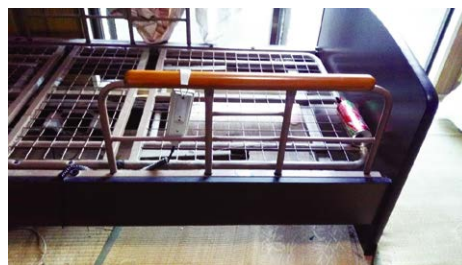
電動ベッド (未使用に近い状態です)