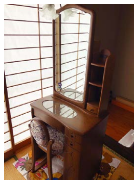
鏡台 (未使用に近い状態です)