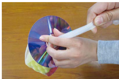
水切りネットをCDの穴に通して絞る