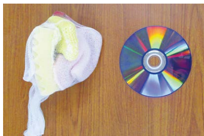
不要なCDと水切りネットを用意