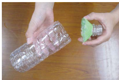
ペットボトルの先端を切る