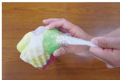
水切りネットをペットボトルの穴に通して絞る