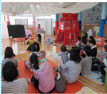
▲誕生会を楽しむ親子

4月19日(水)、げいのうわんぱくで、芸濃子育て支援センター「ぶちぶち」の誕生会が開催され、多数の親子が参加し、親子のふれあいや保護者同士の交流を楽しみました。