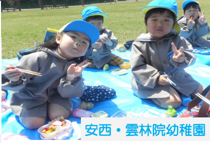
安西・雲林院幼稚園