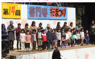
▲明幼稚園親子が歌を披露