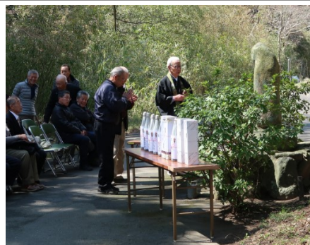
▲手を合わせる出席者

4月2日(日)、瀬野地内にある鳥獣慰霊碑前において、三重県猟友会津支部芸濃分会主催の鳥獣慰霊祭が、関係者出席のもと執り行われました。