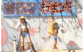
▲バルーンパフォーマンス

4月2日(日)、普門寺で桜まつりが開催されました。明幼稚園親子による歌とダンス、亀山市吹奏楽団による演奏会、エルさん