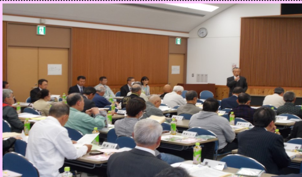
▲芸濃庁舎2階で開催された芸濃支部総会