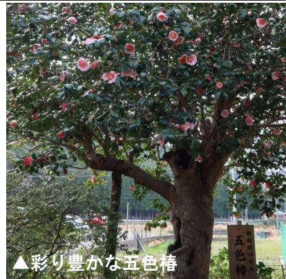
▲彩り豊かな五色椿

4月に見ごろを迎えた浄得寺(河内梅ヶ畑)の五色椿。新聞で紹介されたこともあり、遠方からもたくさんのお客様が訪れました。