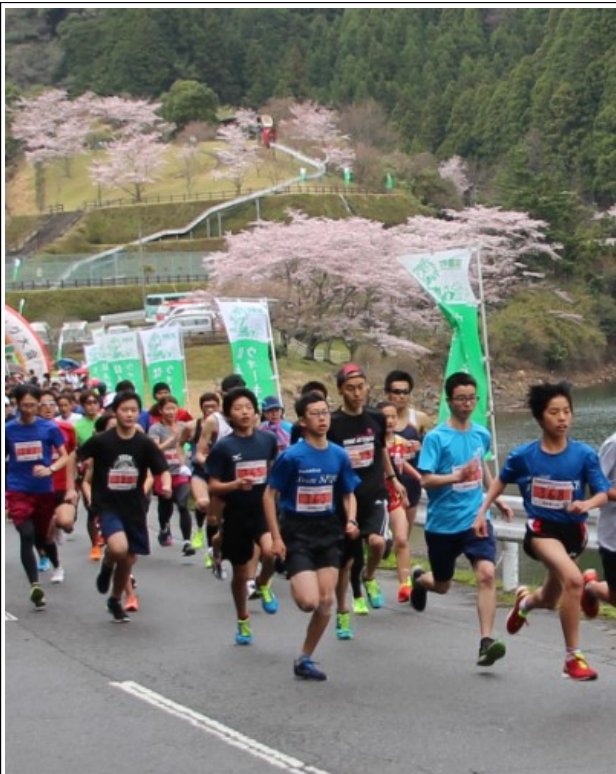
▲勢いよくスタートする参加者

大会シンボルの長徳寺の龍王桜はつぼみでしたが、コース沿いの桜は、開催に合わせたかのように咲き揃い、参加者を出迎えてくれました。