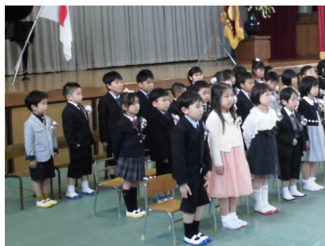
芸濃小学校入学式(4/6)

地域の各小中学校で入学式、幼稚園と保育園で入園式が行われ、芸濃中学校に70人、芸濃小学校に51人、明小学校に11人の新入生が、椋本幼稚園に19人、明幼稚園に7人、芸濃保育園に29人の新入児がそれぞれ入学・入園しました。