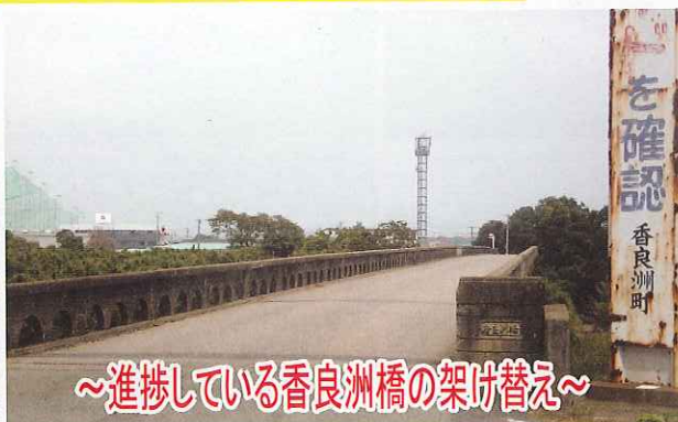
～進捗している香良洲橋の架け替え～