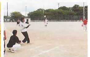
各種スポーツ大会