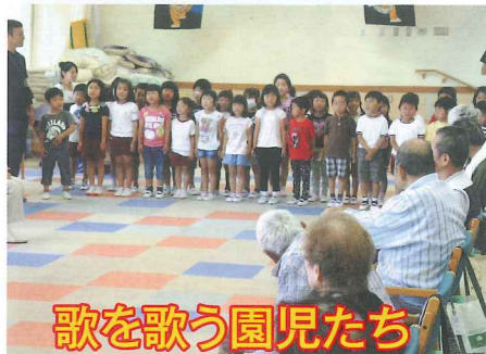
歌を歌う園児たち