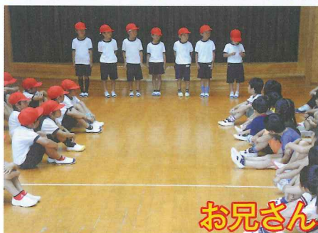
お兄さん、お姉さんまた一緒に遊ぼうね!!