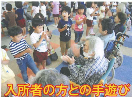
入所者の方との手遊び