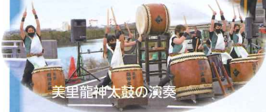
美里龍神太鼓の演奏