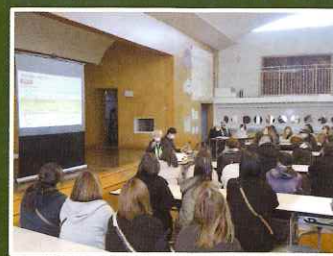
保護者への講話会

○ 1月26日、香良洲小学校にて防災教育授業が行われました。自衛隊、消防、三重県から講師を招き、各学年で防災について学びました。授業終了後、保護者を対象に、津市自主防災協議会香良洲支部による講話が行われました。