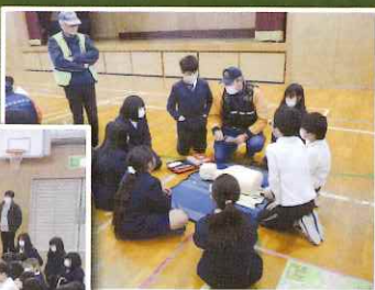
6年生 災害時の活動等の講話