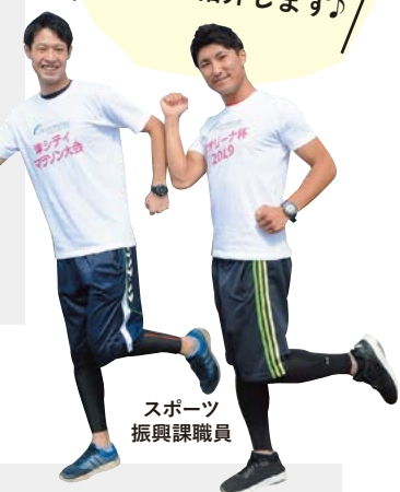
スポーツ振興課職員