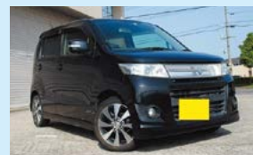
公売した差し押さえ物件

差し押さえ 財産調査で明らかになった不動産、預貯金、給与、年金、自動車、生命保険などの財産を差し押さえます。