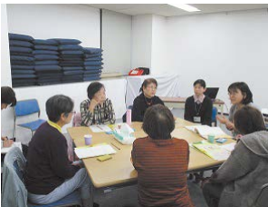
市民との意見交換会

平成28年に改正された自殺対策基本法の中で、全ての自治体に自殺対策計画の策定が義務付けられました。津市では、平成30年7月に自殺対策推進会議を設置し、さまざまな事業を洗い出す