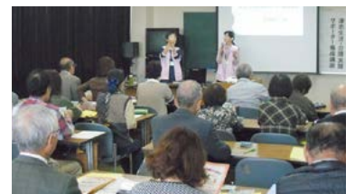
メンタルパートナー養成講座